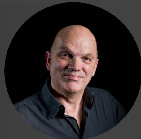
Figura icónica del mundo bandístico mundial y uno de los compositores más programados por las bandas andaluzas en los últimos 30 años gracias a su estilo compositivo, con una música motivadora, alegre y llena de fuerza que imprime en cualquier músico, y en el público que la escucha, atención y gran interés.